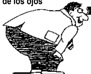
Los DESEOS de los ojos