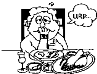
Los DESEOS de la carne

No améis al mundo, ni las cosas que están en el mundo. Si alguno ama al mundo, el amor del Padre no está en él. Porque todo lo que hay en el mundo, los deseos de la carne, los deseos de los ojos, y la vanagloria de la vida, no proviene del Padre, sino del mundo. I Juan 2:15-16